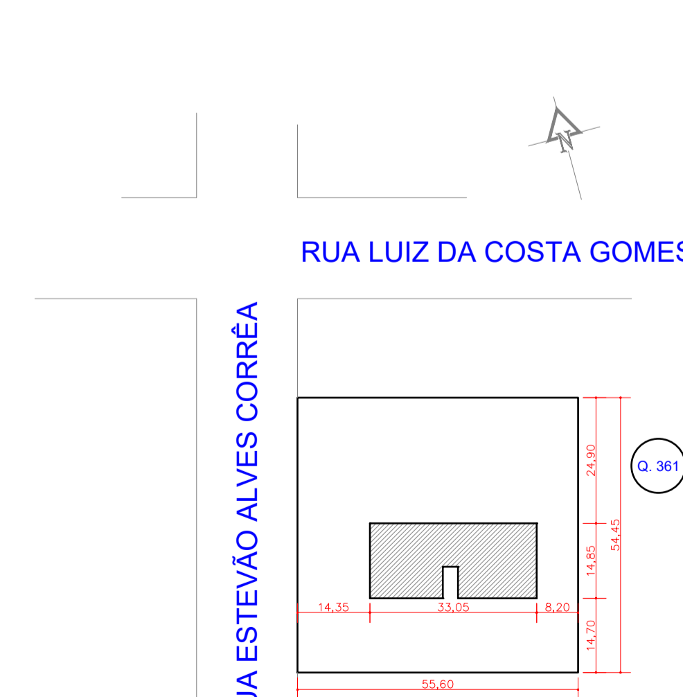
PLANTA DE LOCALIZAÇÃO ESCALA 1:1000