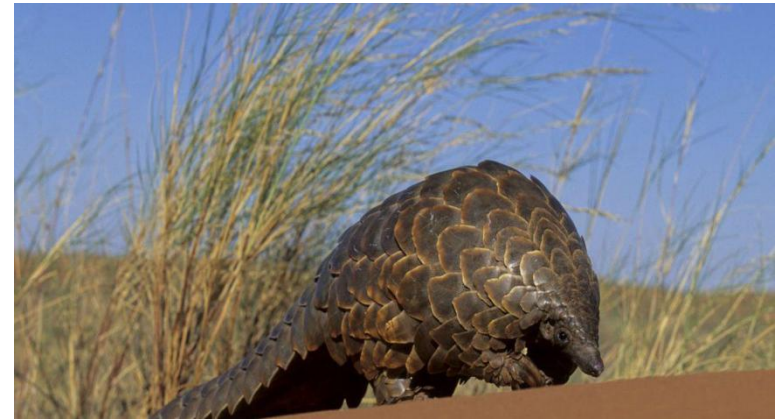
pangolins malaios (Manisjavanica)

Crescem as evidências de que o Pangolim foi o animal de origem do novo coronavírus.